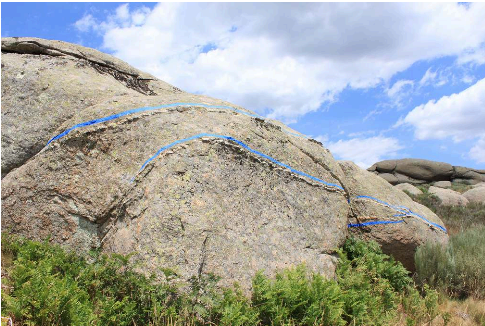
Azucena Pintor. Líneas ingravidas (2012)

"Supone sentirme unificada con el espacio y el tiempo, ser capaz de percibir el espíritu del lugar como un rizoma ingravido que lo envuelve todo, recordándome que pertenezco a la Tierra, esa Gran Diosa que posee todo y a todos". (Azucena Pintor)