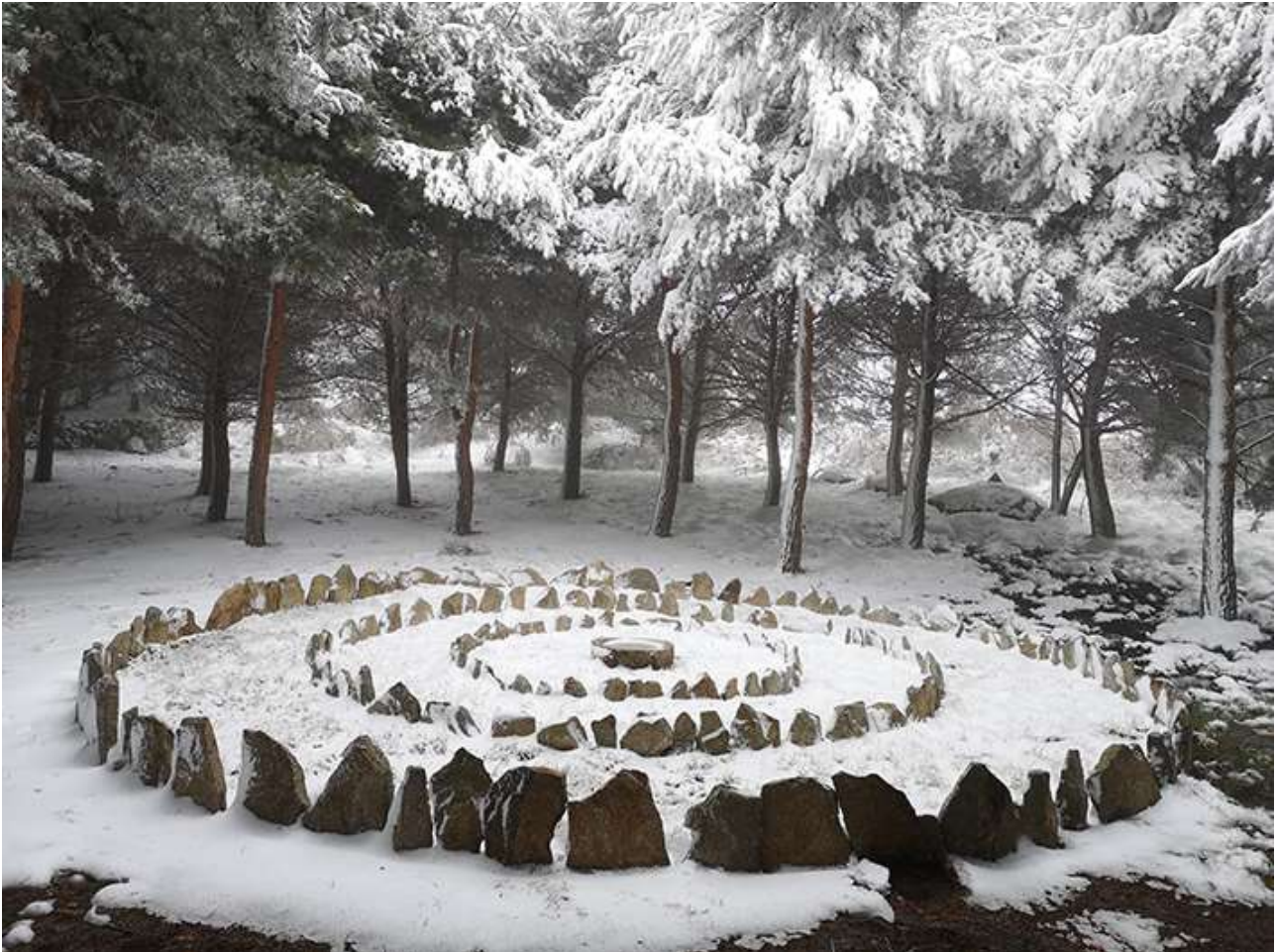
Mar de la tranquilidad. Azucena Pintor. 2023

Nuestro espacio posibilita la experiencia de bajar una “Nube”, apoyarse o subirse a ella y fotografiarse con las nubes del horizonte. Poesía hecha realidad. Otra obra, “El Laberinto”, además de recorrerse, tiene un trasfondo simbólico y místico para debatir.