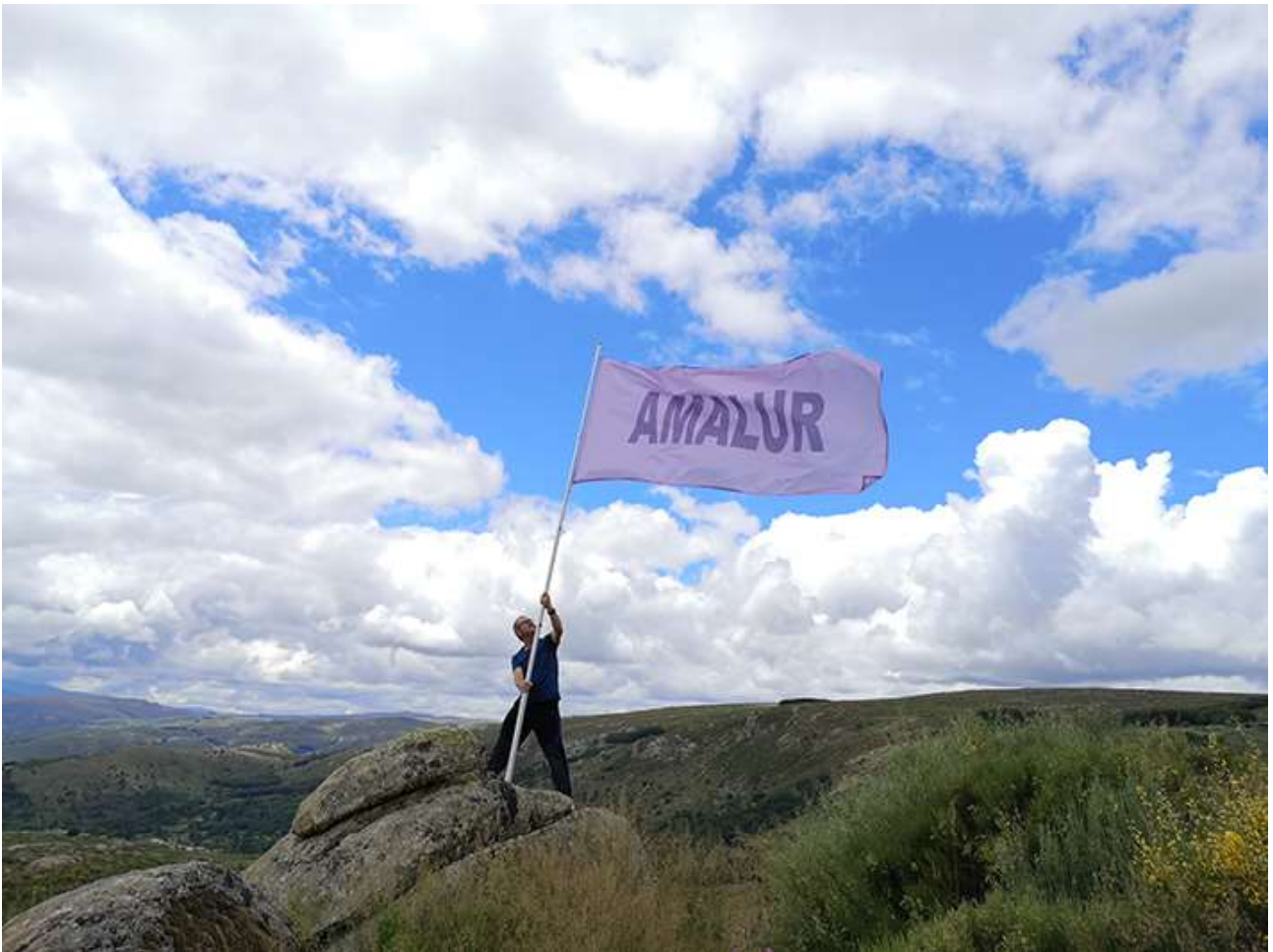
AMALUR-Madre Tierra. Zirika. 2024

El Cerro se encuentra a 2 km del municipio abulense de Hoyocasero y es un magnífico promontorio que alcanza toda la cuenca alta del río Alberche, a sus espaldas se contempla la Sierra de la Paramera y hacia poniente queda el macizo central de la Sierra de Gredos. En dirección sur tenemos los puertos de Serranillos y del Pico que permiten el paso de Gredos. Aquí se plantea una relación nueva entre el ser humano y el paisaje. Se desarrollan obras donde el artista debe investigar y trabajar para este territorio y su contexto, lo que le convierte en espectador privilegiado, descubridor de elementos y sensaciones que, muy frecuentemente, pasarían desapercibidas para los habitantes del lugar si dichas obras no existieran. Se trata de valorar esta zona de inestimable legado paisajístico y con posibilidades para que diferentes artistas plasmen la impronta que cause en ellos. A los artistas solamente se les pide que antes de presentar un proyecto lo visiten y que sus obras impliquen al lugar, para que su naturaleza forme parte imprescindible de la misma y así hagan hablar a la naturaleza del lugar más de lo que ya lo hace. Una cuestión de diálogo y expansión del espíritu de su entorno. En el Cerro Gallinero no hay ningún edificio, solamente un cerro para aprender, vivir e investigar todo lo que la naturaleza nos puede enseñar y las personas puedan aportar para que,