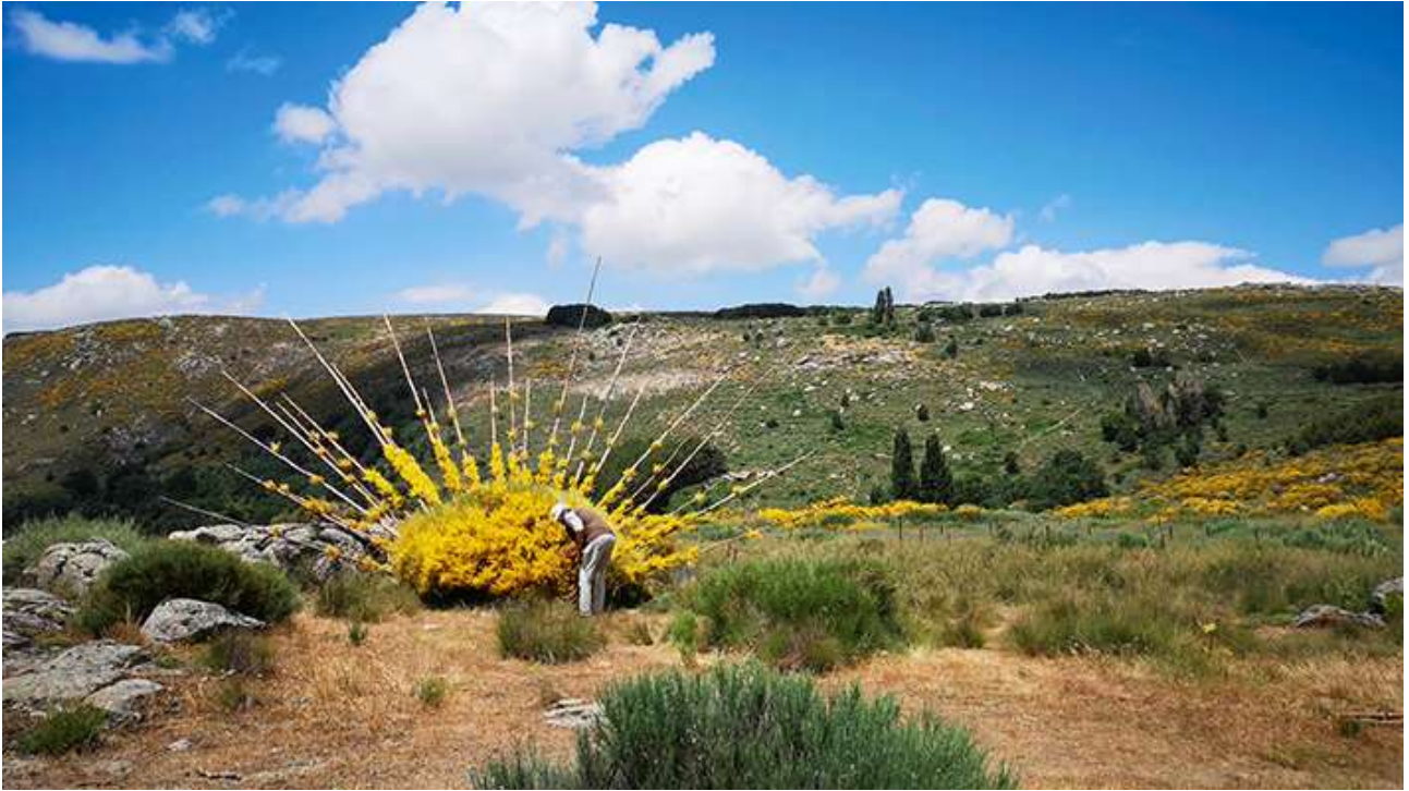
Ginsterlicht-Luz de piorno. NILS-UDO. 2021

con ese diálogo previo, puedan aflorar visiones nuevas.